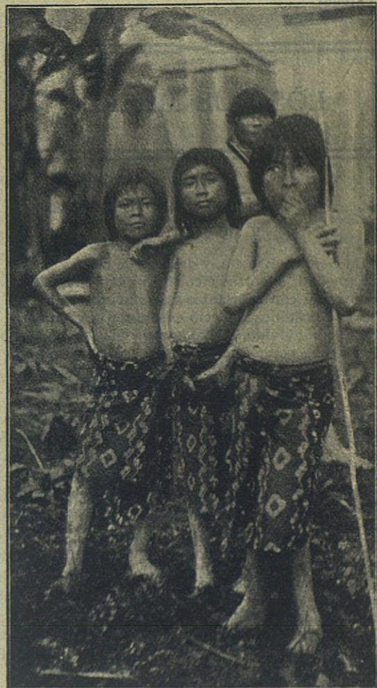
Niños Jíbaros de nuestras misiones del Ecuador.

Como agradecimiento a María Auxiliadora por los favores y gracias concedidas a las misiones Salesianas de la Patagonia desde sus comienzos, se ha empezado en Fortín Mercedes la erección de un Santuario Votivo. Los trabajos, sostenidos úni-