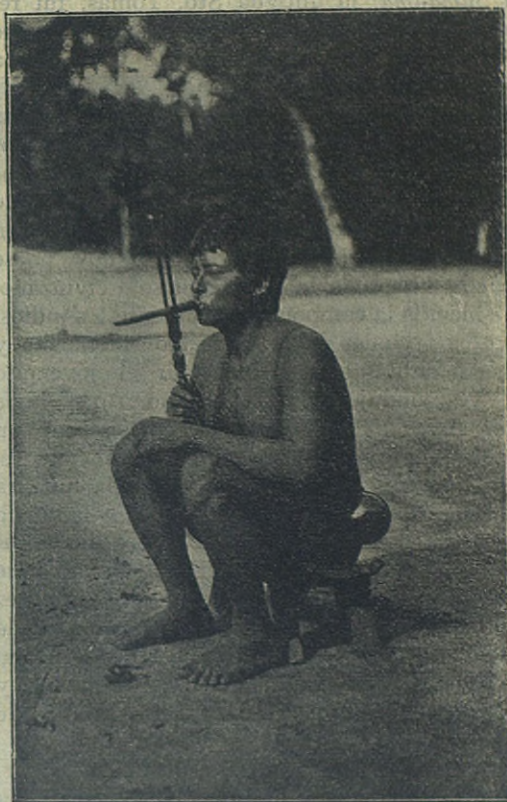
Fumando a la europea.

¡Figúrense lo pernicioso que no será, tanto para la moralidad como para la salud, una