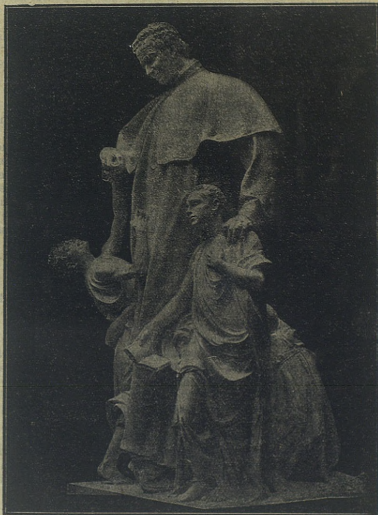
Grupo central del monumento de Don Bosco en Turín.

Redacción y Administración: Via Cottolengo N. 32 - TURIN, 9 (Italia).