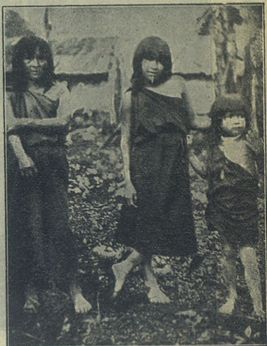
Tres generaciones de Jíbaros : madre, hija y nieto.

— ¿Tonterías, dices? Vosotros los cristianos no conocéis a los Jíbaros , y menos a los brujos. Has de saber que el brujo puede hacer todo el mal que quiera a quién se le antoje. Tiene las