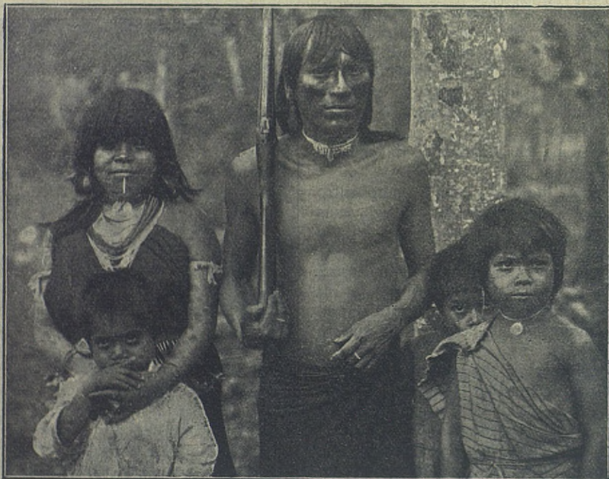
Misiones Salesianas del Ecuador: El Capitán Cayapa.

— ¡Vaya una picardía! Eso no se puede hacer: « Chichau nuarín casamgheip : no robarás la mujer de otro ». Lo has repetido tantas veces cuando los Padres te hacían rezar. ¿Ya lo has olvidado?