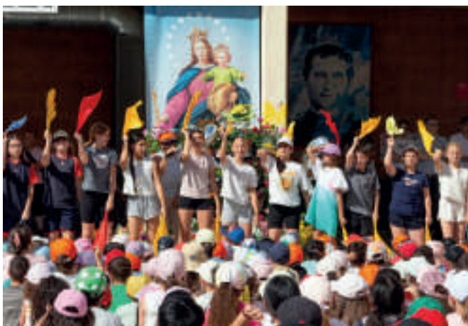
Cantos y bailes en la presencia salesiana de Badalona. Un día muy especial el vivido con los chicos y chicas en el patio.