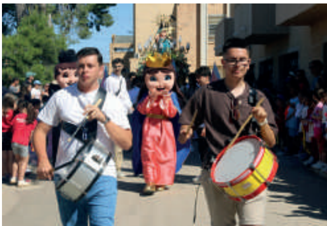
Los niños y niñas de Salesianos Cartagena saludaron alegres a María Auxiliadora en la procesión. La Virgen también les repartió muchos besos.