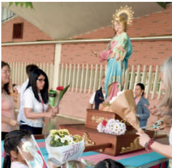
Salesianos Madrid-Domingo Savio. Ofrenda floral de los alumnos más pequeños del colegio.