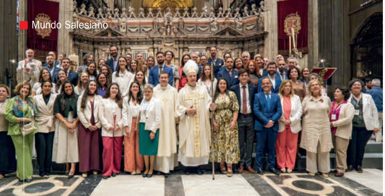
Foto de familia de la celebración de la efeméride en la Catedral de Sevilla, que estuvo presidida por el cardenal Fernández Artime.