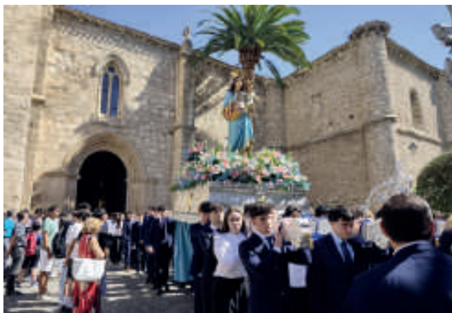
Salida de la procesión de la Virgen Auxiliadora desde la Iglesia parroquial de San Pedro en Ciudad Real.