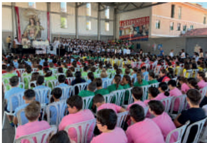
Misa solemne celebrada en Córdoba para alumnos y alumnas del colegio salesiano días previos a la fiesta de María Auxiliadora.