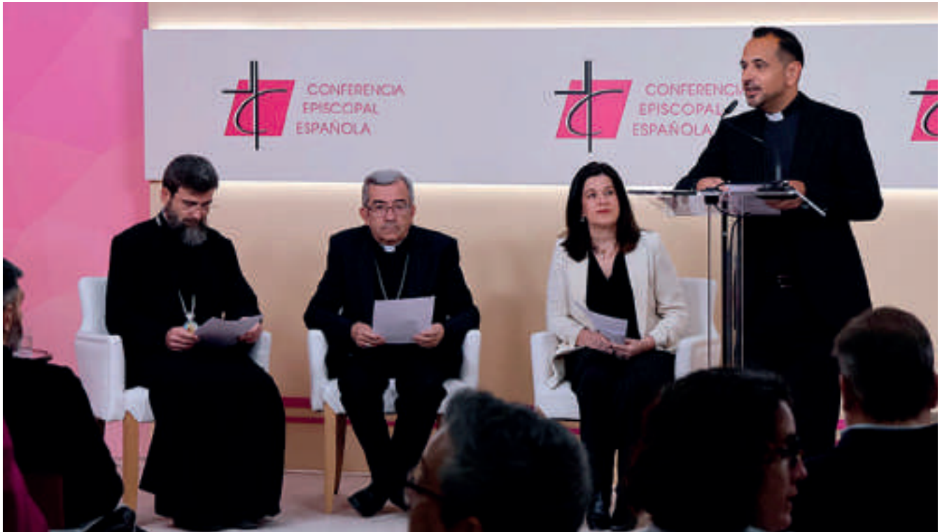
Presentación del Informe en la Conferencia Episcopal Española (CEE).

Once confesiones religiosas han presentado en España el primer informe ecuménico sobre acogida y acompañamiento a migrantes. El documento refleja el compromiso de las Iglesias cristianas con los colectivos vulnerables, visibilizando los obstáculos que enfrentan los extranjeros y planteando soluciones efectivas para su bienestar.