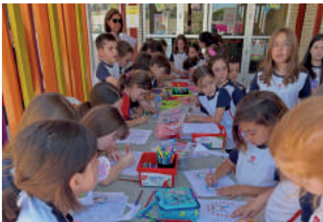
Hay muchas formas de celebrar a María Auxiliadora en los colegios salesianos, muchas. Una de ellas es... ¡pintando! Así lo hicieron en Salesianos Cabezo de Torres.