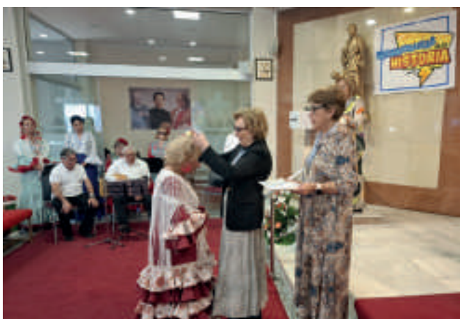
Los días de la Novena y Fiesta a la Auxiliadora son únicos para la Familia Salesiana, especialmente para la Asociación de María Auxiliadora (ADMA). Salesianos Alcoy-Juan XXIII.