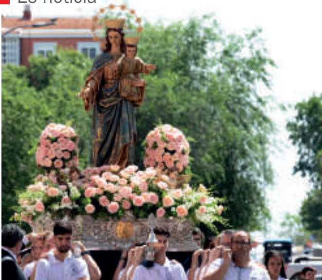
Procesión por María Auxiliadora en las calles de Parla. Recogimiento y devoción por la Virgen de Don Bosco.