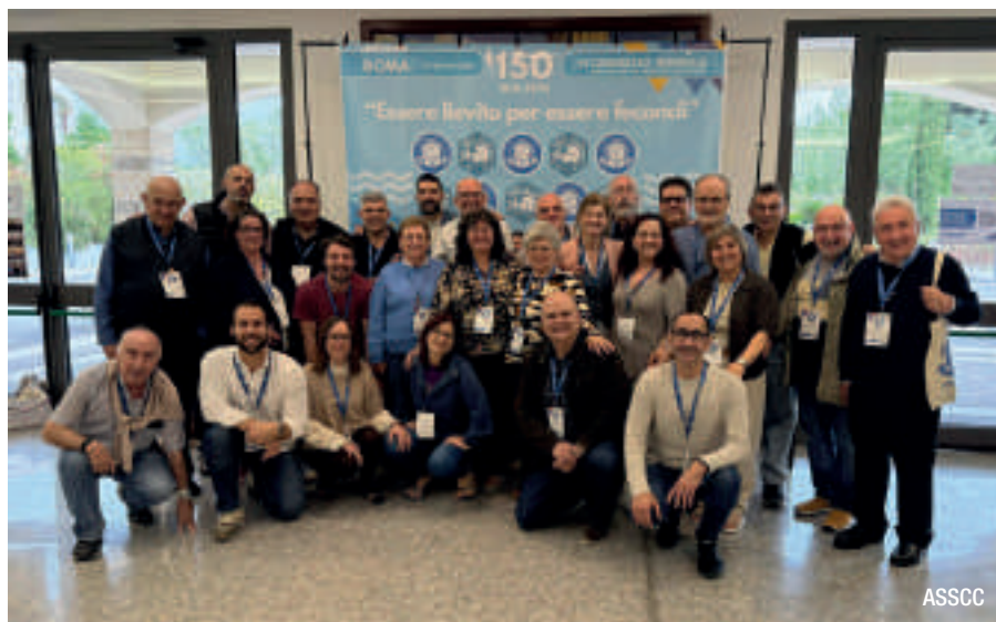
▬ Casi 30 personas participaron de la Región Ibérica de la Asociación.

Y así llegamos al tercer año, el del Relanzar , que nos ha conducido directamente al VI Congreso Mundial. Relanzar no significa empezar de cero, sino mirar hacia adelante con lucidez y valentía. El mundo cambia, la Iglesia se transforma, y la Asociación está llamada a leer los signos de los tiempos con