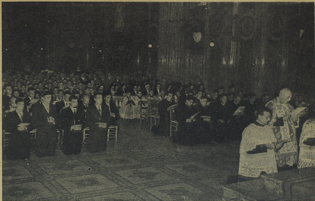
Pocos días antes de su muerte, don Pedro Ricaldone despide en la Basilica de María Auxiliadora de Turín la vigésima expedición misionera de su rectorado y septuagésimasexta de la Congregación Salesiana

Estados de Europa, América, África y Asia, con un conjunto de 3.675 alumnos (1.890 tipógrafos, 1.753 encuadernadores y 32 litógrafos). A nuestras Escuelas se les asignó diploma de oro.