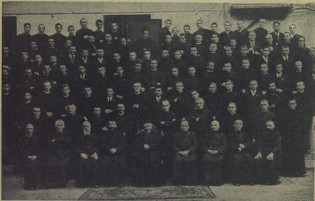
La primera expedición misionera del rectorado de don Pedro Ricaldone que dió un formidable y decisivo impulso a la obra de las misiones Salesianas, hasta el punto de colocar a nuestra Congregación entre las primeras en este campo específico del apostolado religioso

En la Exposición Internacional del Libro y Artes Gráficas —para citar un ejemplo entre cien—, que tuvo lugar en Leipzig el año 1914, tomaron parte 53 Escuelas tipográficas salesianas, 51 Escuelas de encuadernación, cuatro de fundición de tipos, tres de litografía, con 42 editoriales, pertenecientes a 18