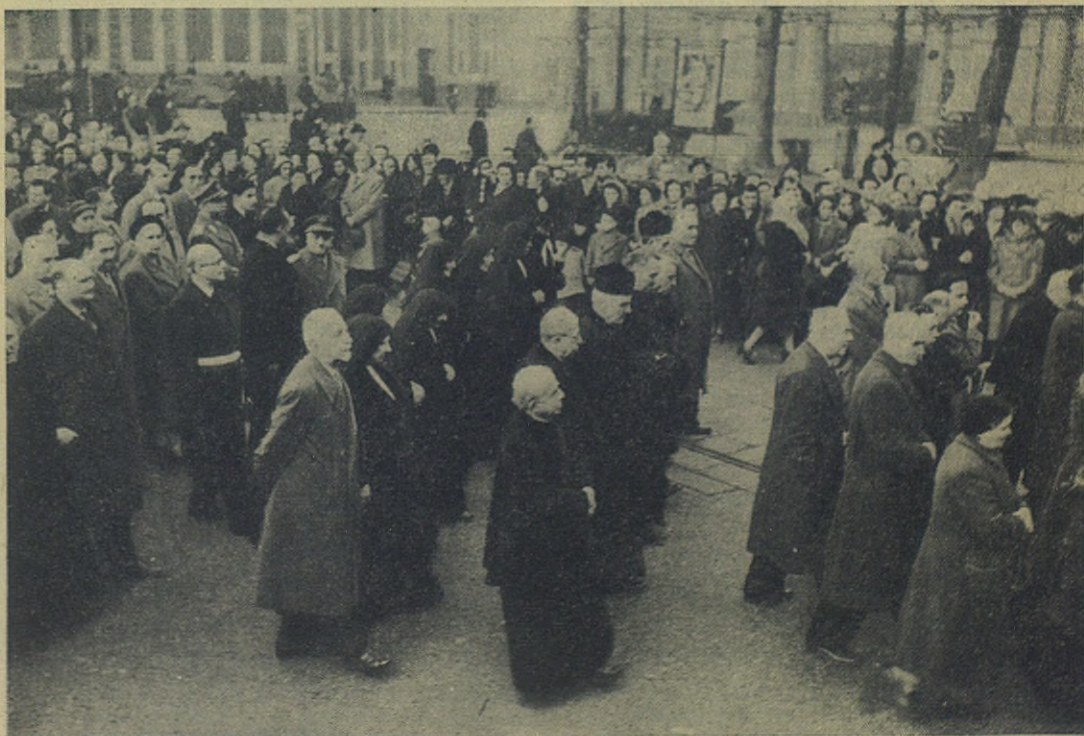
Los miembros del Capítulo Superior de la Congregación y el Capítulo Generalicio de las Hijas de María Auxiliadora en el entierro del Rector Mayor

Habia tenido que guardar cama el día 15. La enfermedad no parecía grave; se trataba, sencillamente, de una afección gripal. Pero sobrevino la complicación, edema pulmonar, que alarmó a los Superiores del Capítulo de la Congregación,