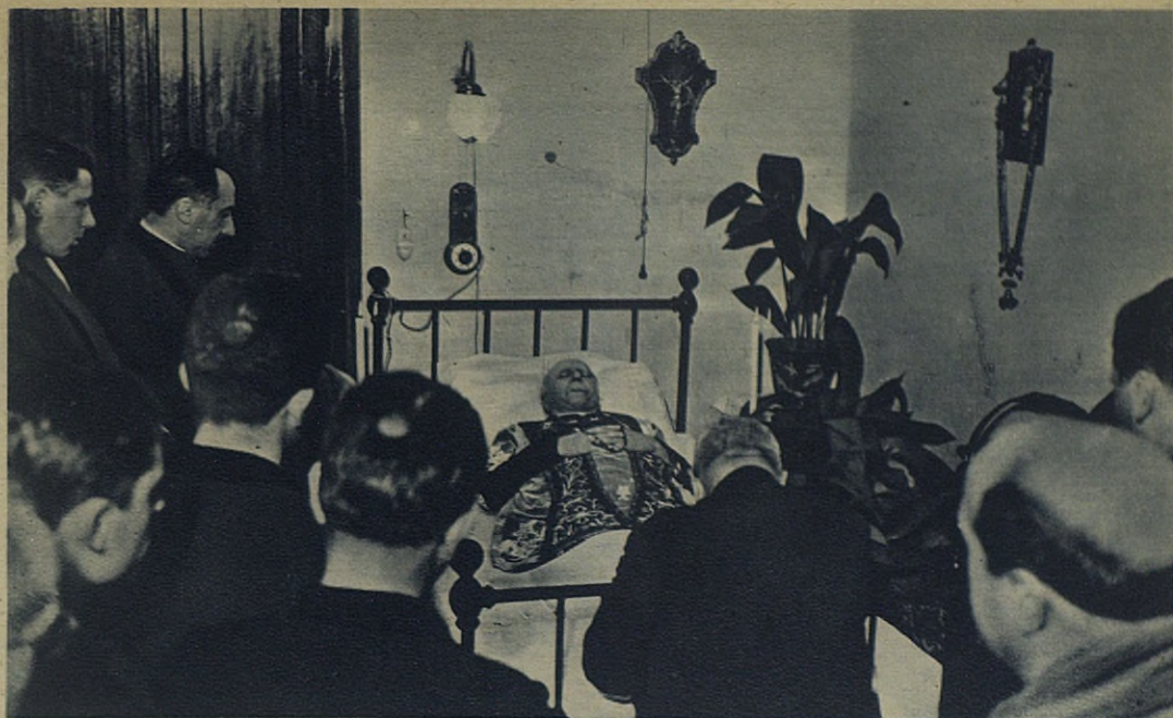
Los hijos, huérfanos de tan grande Padre, rodean el humilde lecho donde acaba de fallecer el IV Sucesor de San Juan Bosco.